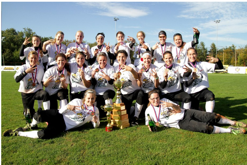
Tým Eagles zůstal po loňské sezoně snů pohromadě a nadále vládne českému ženskému softballu. Finále přineslo krásný, napínavý softball.