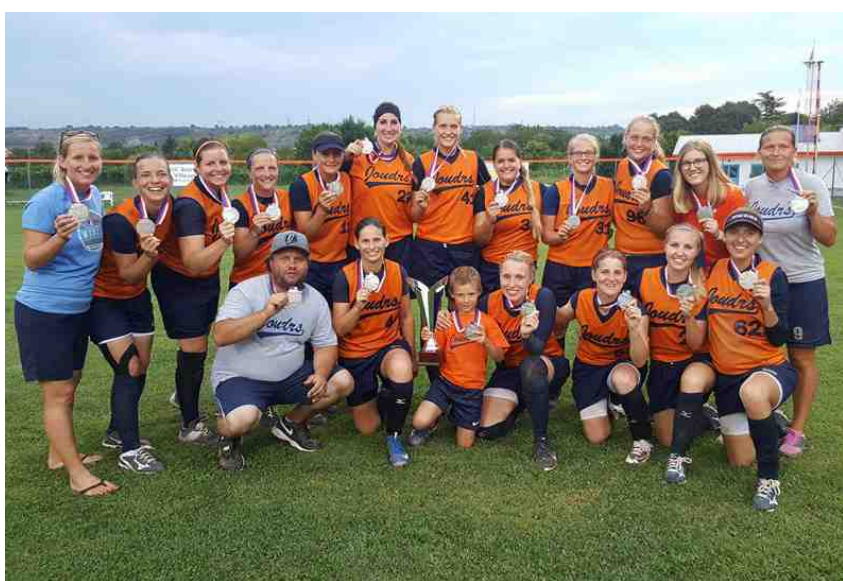
Joudrs Praha jsou aktuálně druhý nejlepší ženský softballový tým v Evropě, důkazem je stříbro na PMEZ 2016 v Itálii.

Jak to bude na podzim? Uvidíme. Oba týmy zcela jistě mají připravené trumfy, které si schovávají právě na ty nejdůležitější boje.