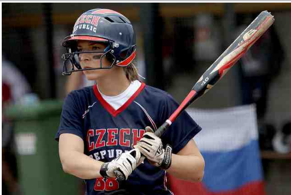
Český týmový sport na OH 2020 v Tokiu? Co třeba softball!.

V Ostravě probíhal Pohár vítězů pohárů s dvojnásobnou českou účastí. Na Moravě to ale bohužel necinklo, Tempo Titans Praha skončilo páté a domácí celek Arrows Ostrava tvořený především hráčkami Snails Kunovice se pak umístil až na 8. místě. Vítězství si vybojoval nizozemský tým Olympia Haarlem, stříbro putuje do Itálie za BSC Legnano.