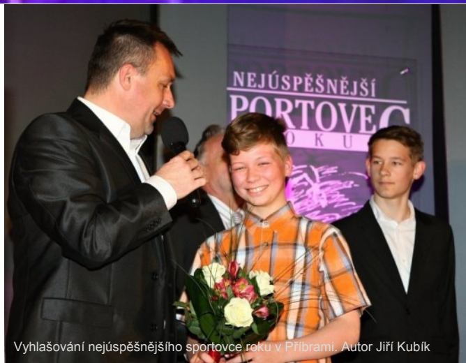
Vyhlašování nejúspěšnějšího sportovce roku v Příbrami.