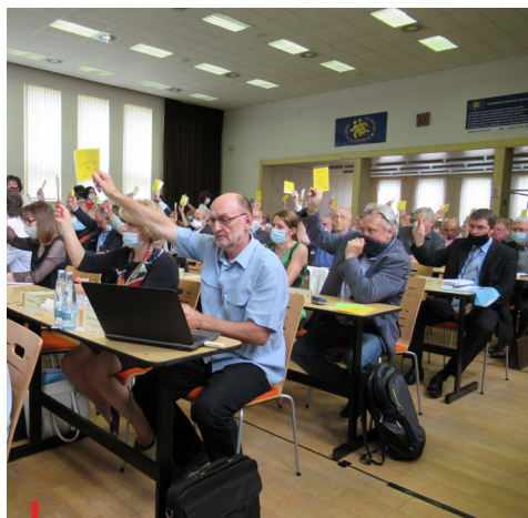
Připomínka Valné hromady ČUS v roce 2020

Výkonný výbor ČUS se zabýval také přípravou 39. valné hromady ČUS, která se uskuteční 23. června 2021 ve Sportovním centru Nymburk. Projednal a schválil text pozvánky, návrh programu jednání, návrh jednacího řádu a organizační pokyny.