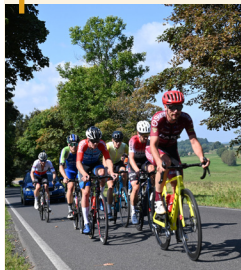
Cyklistický závod Tour de Zeleňák v Rumburku přilákal na start rekordní účast 800 účastníků.