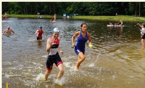
Hradecký terénní triatlon dokonale prověřil všestrannost všech 230 závodníků.

V průběhu letních prázdnin i září se po celé České republice naplno rozběhl projekt České unie sportu Tipsport Sportuj s námi. Z bohaté fotodokumentace od pořadatelů nabízíme obrazový pohled na některé zajímavé akce, které se v tomto období uskutečnily.