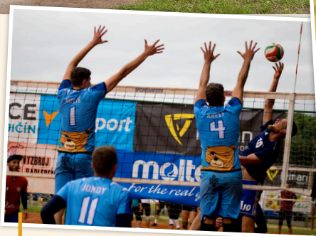
V pořadí 68. Volejbalová Dřevěnice dopadla po roční přestávce na výbornou - pod vysokou síť se představilo 172 týmů a 1 350 hráčů.