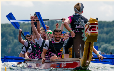
Do Festivalu dračích lodí na Slezské Hartě se zapojilo 32 dvaadvacetičlenných posádek.