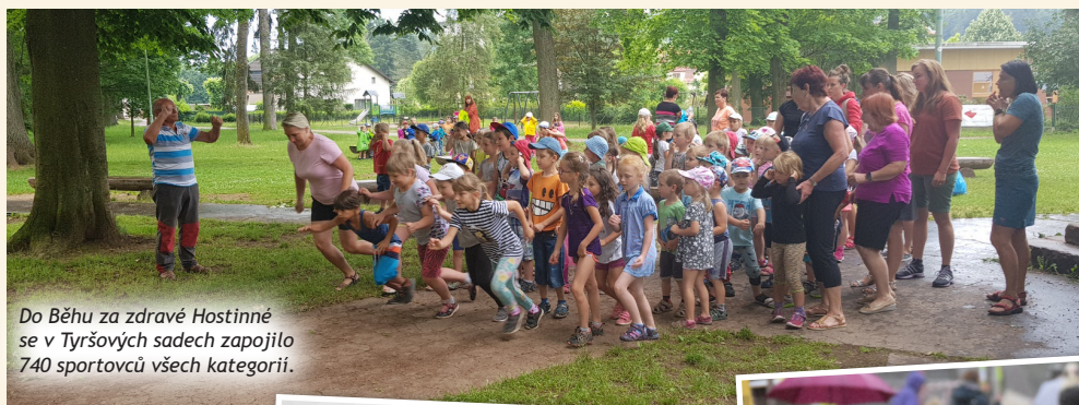
Do Běhu za zdravé Hostinné se v Týršových sadech zapojilo 740 sportovců všech kategorií.