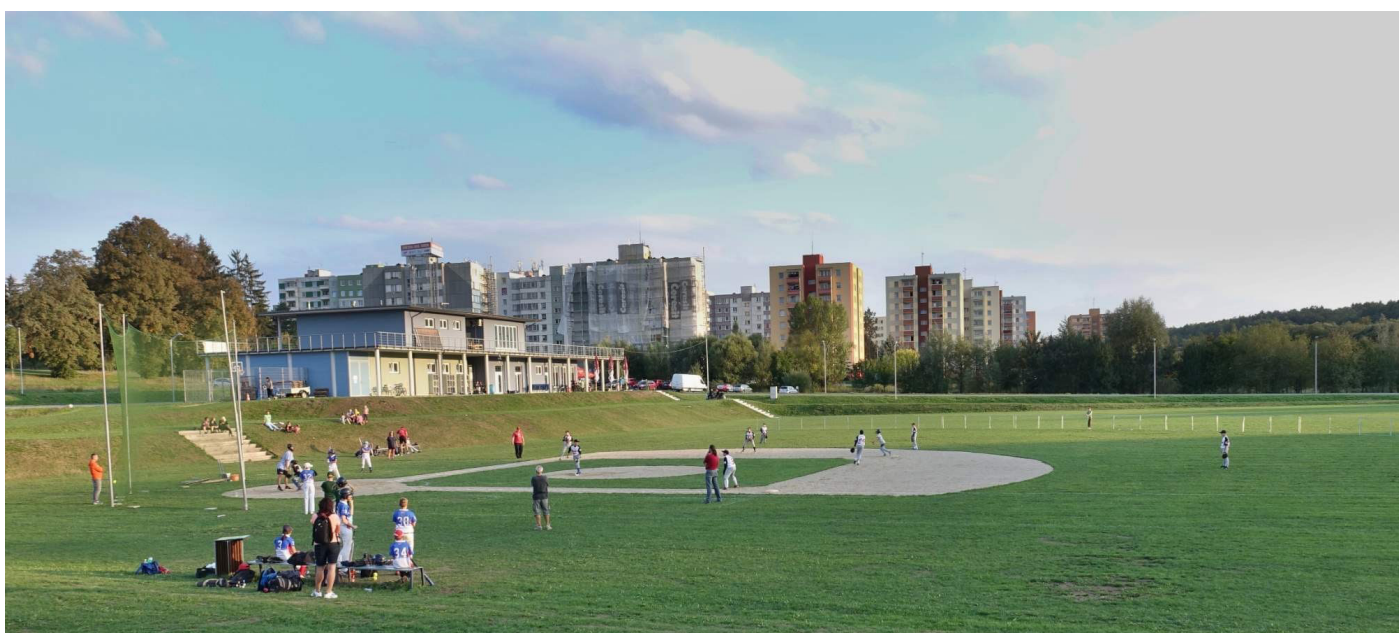
Softballové hřiště v odpočinkové zóně Komora v Táboře postaveno v roce 2013 dle projektu Alenky

Alenka se významně zasazuje o zbudování dalšího softballového hřiště v odpočinkové zóně Komora v Táboře a tím navýšení kapacity zázemí Hladových Hrochů pro pořádání mezinárodních turnajů, které se odráží na obnovení Bařova poháru. Vrcholy těchto akcí přicházejí v letech 2021 a 2022 v podobě jdoucích spolupořádání ME mužů s Žraloci Ledence, pořádání ME mužů U23 a následné ucházení se o pořádání dalších akcí této úrovně. Odrazem kvality trénování a vedení lidí a klubu je účast Hladových Hrochů (mužů) v extralize v letech 2020-2021. Mezi těmito muži jsou žáci, které Alenka za mlada trénovala.