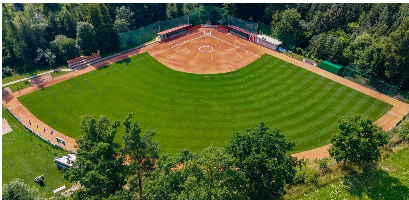
Softballové hřiště u Kozského potoka v Sezimově Ústí a areál Hladových Hrochů vznik 2007 dle projektu Alenky