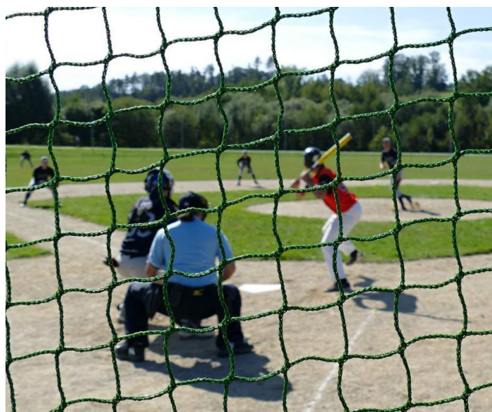
Softballové hřiště v odpočinkové zóně Komora v Táboře postaveno v roce 2013 dle projektu Alenky (foto: V. Kouba - IX.2019)