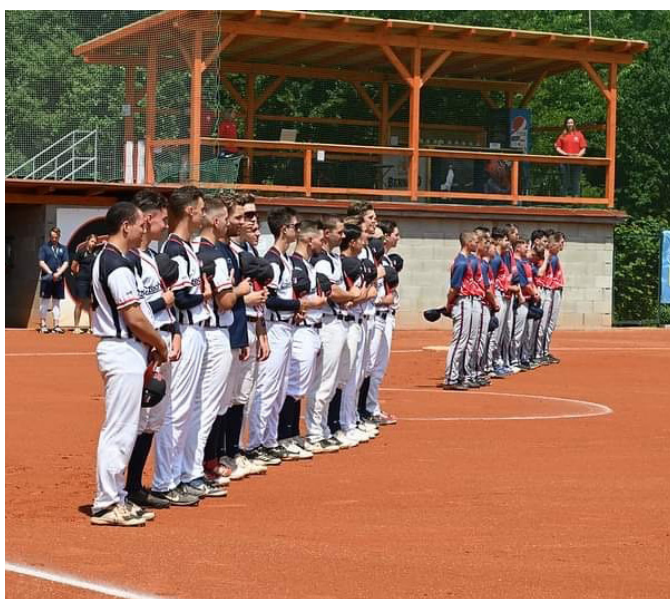
Softballové hřiště u Kozského potoka v Sezimově Ústí a areál Hladových Hrochů vznik 2007 dle projektu Alenky, (foto: V. Kouba - VII.2022 - ME mužů U23 - ČR vs. GB)